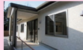
ゆたか 豊 (女性棟)

ご利用者様やご家族の方々、スタッフ自身も喜びを感じられる、そんなグループホームを目指し努めてまいりたいと思います。