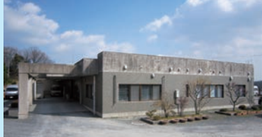
ワークランド・こすもす

職員一同、基本理念である「愛と微笑」を常に心におきながら、一丸となって皆様にご満足いただけるサービスの提供に努めてまいります。