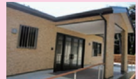
くす 楠 (男性棟)