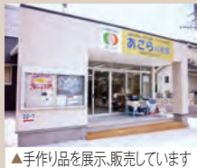
▲手作品を展示、販売しています

が、地域の皆様に支えられながら、元気いっぱい活動しています。たくさんのお会いとチャレンジを楽しみにしているあごらです。今後とも宜しくお願いします。