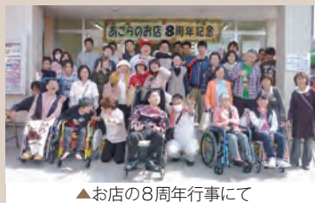
▲お店の8周年行事にて