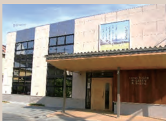
▲最寄駅から徒歩10分圏内の好立地です