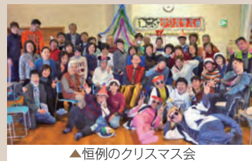
▲恒例のクリスマス会