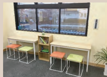
▲モダンなフリースペース