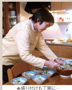
▲盛り付けも丁寧に…