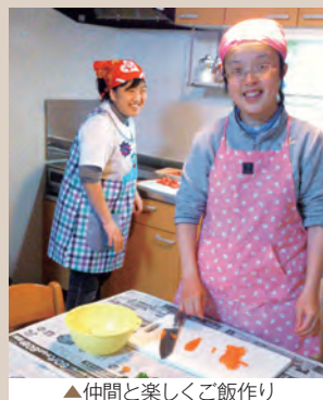
▲仲間と楽しくご飯作り

JOYホームには、男女各6名ずつ、計12名の障がいのある方が生活しておられます。福岡空港駅まで徒歩約10分と便利な立地にあり、日中は同じ法人のJOY倶楽部で働いている方の他、天神や博多駅近郊で就労している方もいらっしゃいます。職員や地域の支援によって、またホームでの共同生活を通しての利用者同士の支え合い育ちあいによって、それぞれ持っている力を活かしながら、いきいきとした生活を送ることができるよう、支援しています。