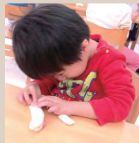
▲小麦粉粘土あそび